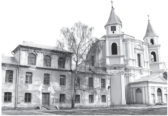
Trinitorių bažnyčia ir vienuolynas, kur 1993 m. rudenį pradėjo veiklą atkurtoji Vilniaus kunigų seminarija.

Joanitų vyresnysis sutiko padėti, nes, manau, pajuto, jog Lietuvai reikia pagalbos, o mūsų užduotis ir yra tarnauti Bažnyčiai ten, kur pagalbos labiausiai reikia. Padėti atidaryti seminariją yra tikrai labai svarbus prašymas. Antra, Lietuvos Bažnyčia yra kankinių Bažnyčia, žmonių, kurie daug kentėjo ir turi daug žaizdų – turėjome atsilipti. Trečia, joanitai jau turėjo tam tikrų ryšių su Lietuva: nuo 1989 metų kasmet jaunimas važiuodavo iš Prancūzijos į Lietuvą susitikti su Lietuvos jaunimu, rekolekcijoms arba tiesiog bendrystei. Dėl viso to mūsų vyresnysis ir išsiuntė kelis brolius į pagalbą.