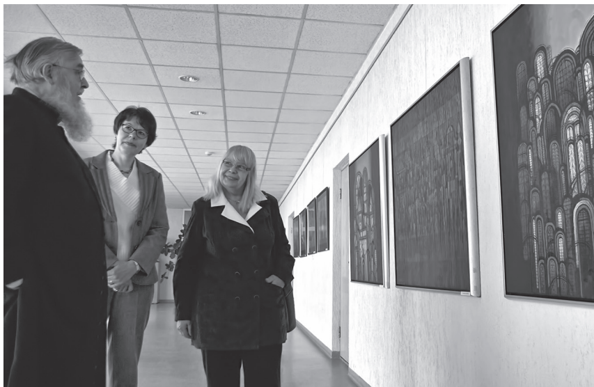
Susitikimas su ekponuojamų darbų autore parodos pristatymo metu.

palėpėje, saulės nutviekstame keliolikos kvadratinų metrų kambarėlyje buvo pastatytos trys ar keturios knygų lentynos, rašomasis stalas ir senas kopijavimo aparatas. Ant darbo stalo – rašiklis ir sąsiuvinis, kuriame patys studentai registravo paimamas ir grąžinamas knygas. Tuomet supratau, kad siekiant sukurti modernią ir šiuolaikišką aukštosios mokyklos biblioteką, manęs laukia didžiulis, atsakingas ir labai sunkus darbas, reikalaujantis žinių ir gero profesinio pasirėngimo, organizacinių gebėjimų, šiuolaikinių technologijų išmanymo, duomenų bazių administravimo patirties ir kitų kompetencijų. Būsiu atvira – išsigandau, ar sugebėsiu, ar nenuvilsiu rektoriaus ir tuometinio Vilniaus arkivyskupo metropolito A. J. Bačkio, ar savo darbu pateisinsiu jų lūkesčius? Buvo labai sunku, ir ne tik fiziškai. Nuo darbų krūvio kartais nusvirdavo rankos, nes teko perkrauti, išrūšiuoti šimtus dėžių knygų, kurias per Lietuvių katalikų religinę šalpą atkurtai Vilniaus seminarijai siuntė išeivijos lietuviai, dovanojo leidyklos, paramos fondai, kunigai, kiti geros valios žmonės. Tačiau naujojoje seminarijoje vyravusi pakili įkurtuvių nuotaika, seminaristų entuziazmas, vadovybės supratimas ir palaikymas nepastebimai greitai atstatydavo